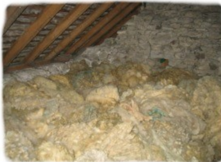
Laine de mouton

Sur un chantier assez important comme par exemple une maison de 130 M2 avec un étage, cela peut vite chiffrer selon l'isolation choisie.